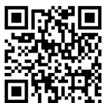
Maxtron + HAWE RUW auf Ketten