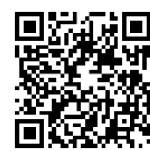
Aussaat mit TPL 24

Wenn wir Dein Interesse geweckt haben, melde Dich gerne, wir freuen uns auf ein persönliches Kennenlernen: