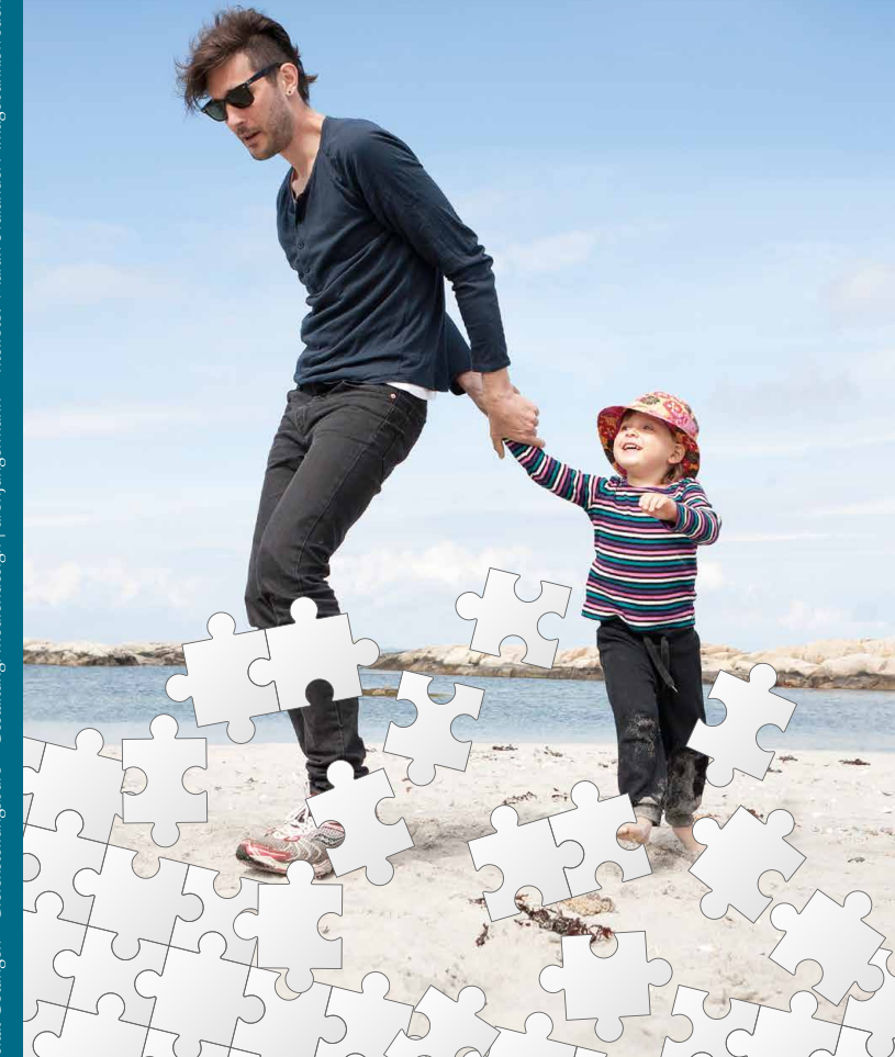
© 2014 Georg-August-Universität Göttingen • Gleichstellungsbüro • Gestaltung: mediadesign | aronjungermann • Titelfoto: Martin Svalander / imagebank.sweden.se