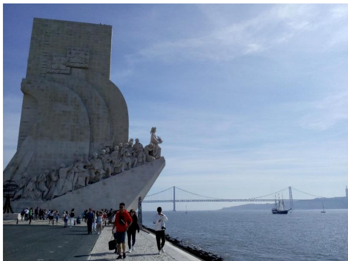
Das „Entdeckungs-Denkmal“ am Flussufer des Tejo

Über U-Bahn, Bus und Tram kann man sich im Stadtbereich gut bewegen. Ein Semesterticket oder ähnliches seitens der Universität gibt es nicht, dafür kann man sich ein Monatsticket kaufen. Für den Stadtbereich kostet dies 36,70 Euro (für unter 23jährige gibt es noch 25 % Rabatt). Kulinarisch kann man es sich in Portugal gut gehen lassen: Die Portugiesen essen gerne gut (vor allem Fisch und die Varianten des Nationalgerichts bacalhau , Kabeljau) und trinken gerne Kaffee (Espresso) und Wein. Die Lebenshaltungskosten sind tendenziell eher geringer als in Deutschland. Ich kann einen Aufenthalt in Lissabon nur empfehlen und würde es jederzeit wieder machen!