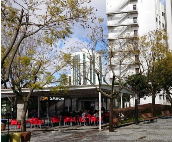
Innenhof des Campus mit Café